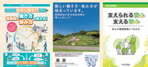
各制度に関するリーフレット（例）

「勤務間インターバル制度」「時間単位の年次有給休暇制度」「特別な休暇制度」などについて、企業の取組事例の紹介や、リーフレットなどの資料を掲載しています。自社における制度検討の参考にご活用ください。