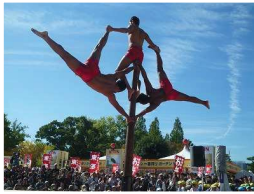
11月大道芸ワールドカップ