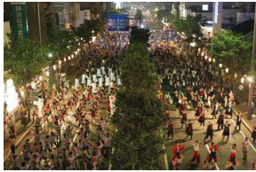
8月清水みなと祭り