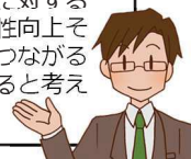
年次有給休暇取得のメリット

年次有給休暇を取得しやすい環境は、仕事に対する意識やモチベーションを高め、仕事の生産性向上としてイメージの向上や優秀な人材の確保につながるなど、事業場、従業員双方にメリットがあると考えられます。