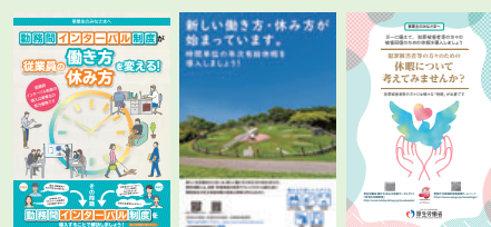
各制度に関するリーフレット(例)

「勤務間インターバル制度」「犯罪被害者等の被害回復のための休暇」「時間単位の年次有給休暇」「特別な休暇制度」などについて、企業の取組事例の紹介や、リーフレットなどの資料を掲載しています。