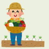
障がい者の農業体験のお手伝い