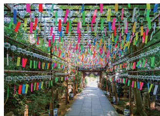
如意輪寺風 鈴まつり