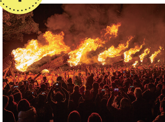
大善寺玉垂宮の鬼夜