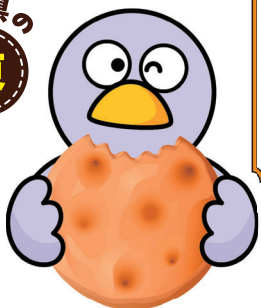
草加せんべいを食べている ご当地コバトン(草加市)