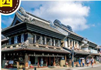
蔵造りの町並み(川越市)