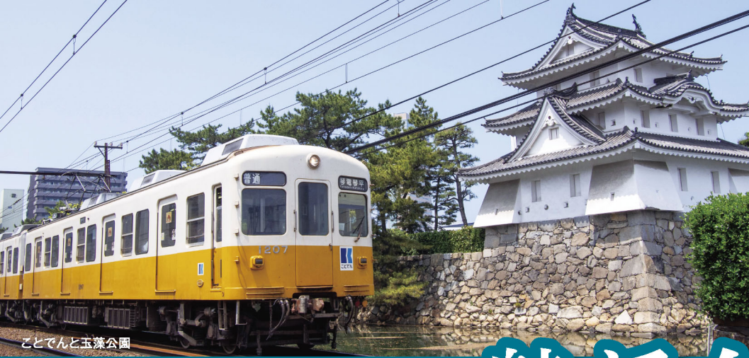
ことでんと玉藻公園