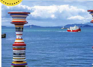
瀬戸内国際芸術祭