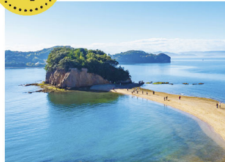
小豆島 エンジェルロード