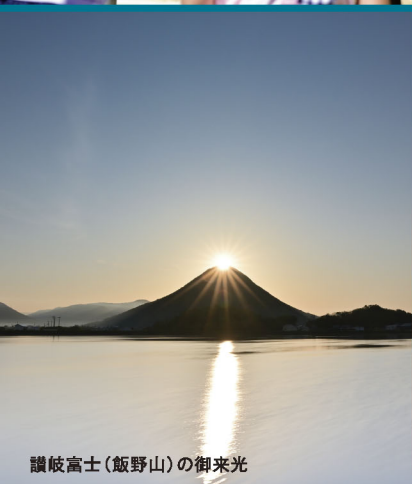
讚岐富士(飯野山)の御来光