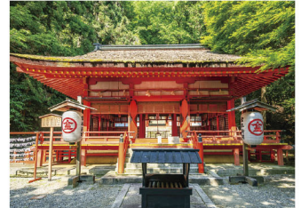
こんびらさん(白峰神社)