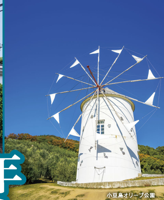
小豆島オリブ公園