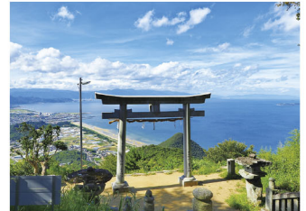
観音寺市 高屋神社