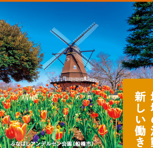
ふなばしアンデルセン公園(船橋市)