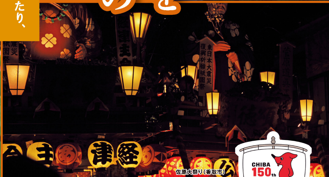
佐原大祭り(香取市)