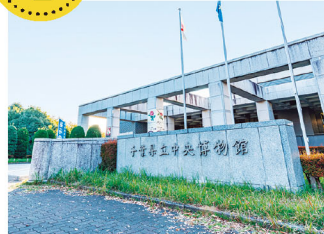
千葉県立中央博物館