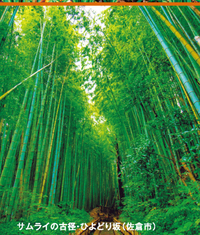
サムライの古径・ひよどり坂(佐倉市)

年次有給休暇を取得して、家族と過ごしたり、地域の活動に参加したり、新しい働き方・休み方をはじめましょう。