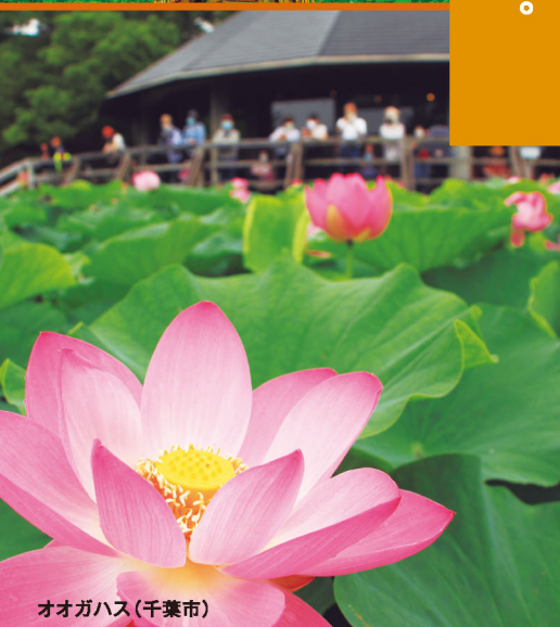
オオガハス(千葉市)