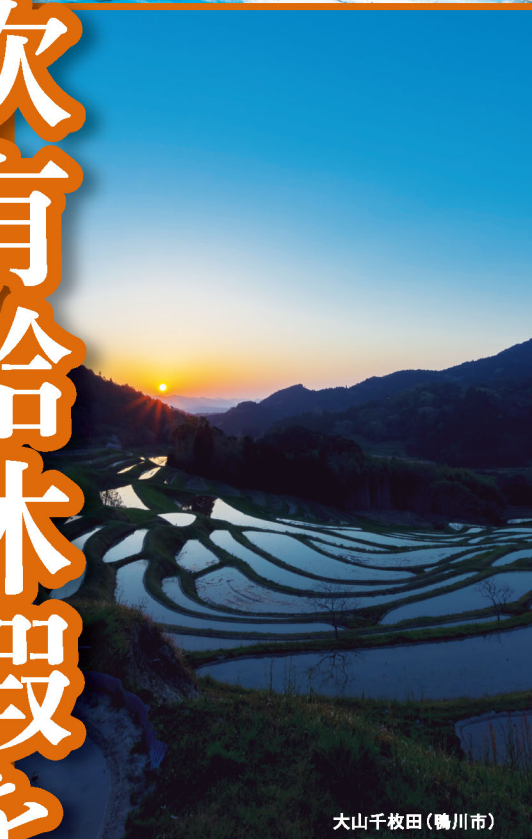
大山千枚田(鴨川市)