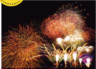
幕張ビーチ花火フェスタ