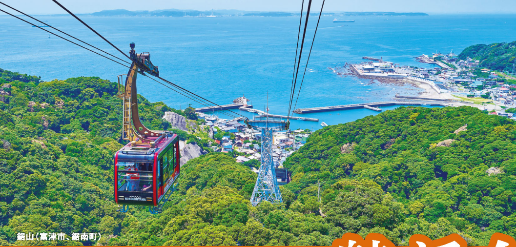
鉾山(高津市、鉾南町)