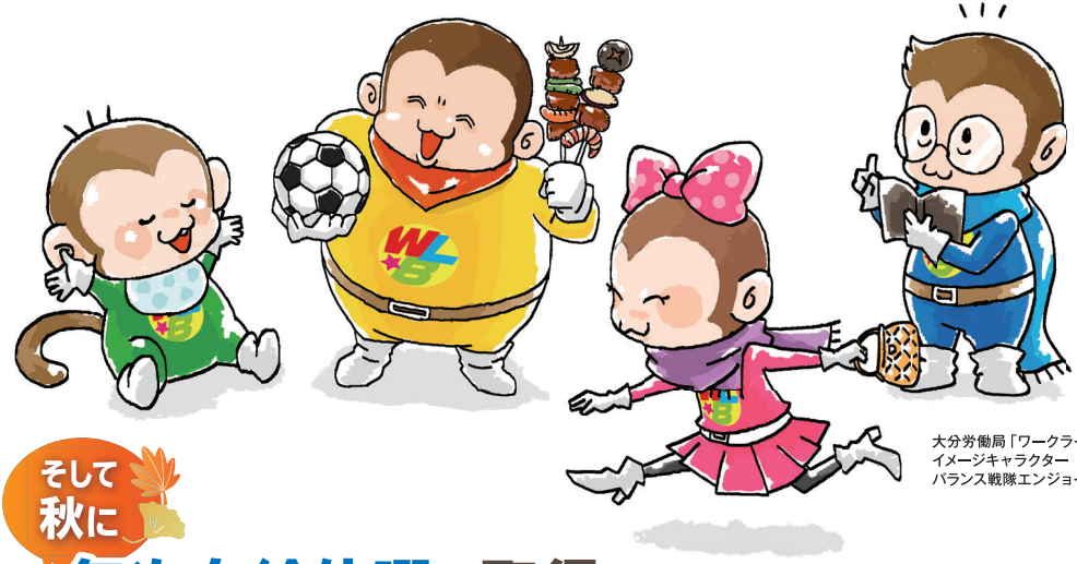
大分労働局「ワークライフバランス」 イメージキャラクター バランス戦隊エンジョイ5