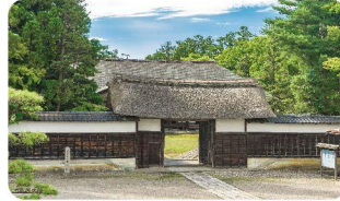
歴史的建造物・文化財