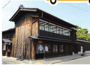
歴史的建造物・文化財