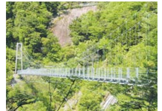
水上村 吊橋・白龍妃橋