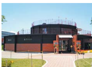
人吉市 MOZOCAステーション868