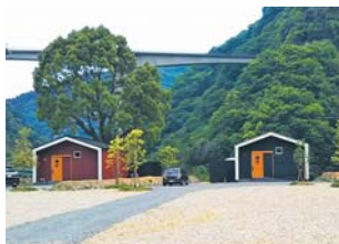
五木村 溪流ヴィラ ITSUKI