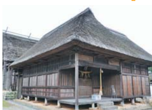
山江村 山田大王神社