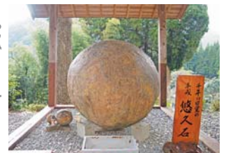
多良木町 平成悠久石