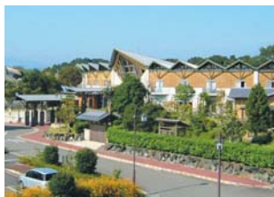
相良村 さがら温泉 茶湯里