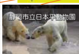
静岡市立日本平動物園