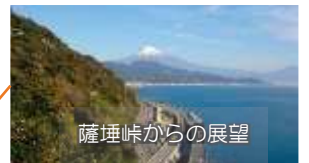
薩埵峠からの展望