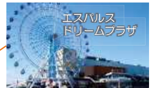
エスパルスドリームプラザ