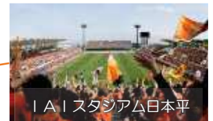
IAIスタジアム日本平