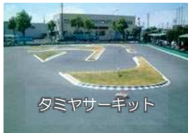
タミヤサッカーキット