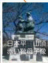
日本平山頂赤い靴母子像